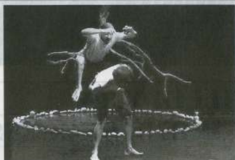
Una scena dello spettacolo «Genesi quattrotrono»

●●● Stasera alle 21,30 al Baglio delle Case Di Stefano di Gibellina, nell'ambito del Festival Orestyadi, andrà in scena «Genesi quattrotrono, Caino e Abele, genesi di una fratellanza deviata» di Gaetano Bruno, testo e musiche di Gaetano Bruno. Il lavoro, che trae ispirazione dalla nota vicenda di Caino e Abele del libro della Genesi (capitolo 4, versetto 1) della Bibbia, concentra il suo sviluppo sul rapporto d'amore tra due fratelli. In genesiquattrotrono l'omicidio è già stato compiuto. Ora, nel sonno, si cerca di «riprendere fiato». Biglietti: 10 e 8 euro. (*MAX*)